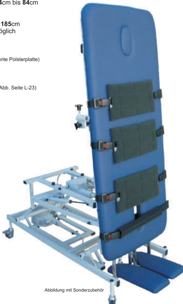
Abbildung mit Sonderzubehör